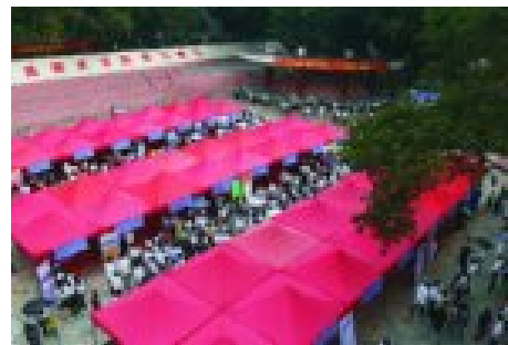
粤就业—高校联合精准双选会