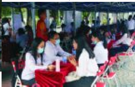
粤就业—高校联合精准双选会毕业生面试过程