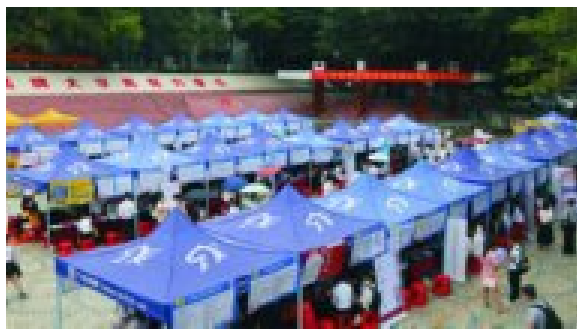
2021年春季校园专场招聘会暨实习专场双选会

就业方向： 本专业毕业生能够在政府管理部门、城镇事业单位、社会团体、公共服务行业及中介服务组织从事公共事业管理，能胜任社区管理、社区规划与建设、社区服务等工作。