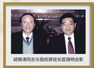
胡锦涛同志与我校原校长匡镜明合影