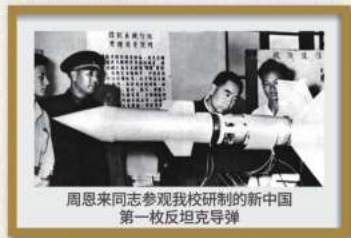
周恩来同志参观我校研制的新中国第一枚反坦克导弹