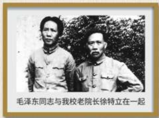
毛泽东同志与我校老院长徐特立在一起