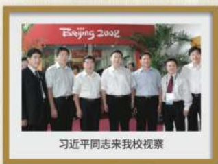
习近平同志来我校视察