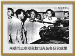
朱德同志参观我校坦克装备研究成果