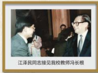
江泽民同志接见我校教师冯长根