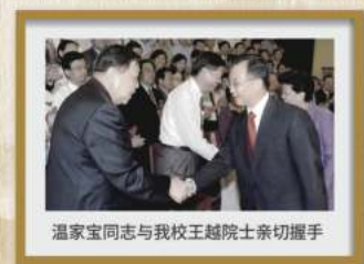
温家宝同志与我校王越院士亲切握手