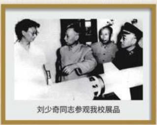
刘少奇同志参观我校展品