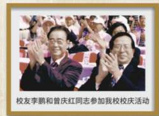
校友李鹏和曾庆红同志参加我校校庆活动