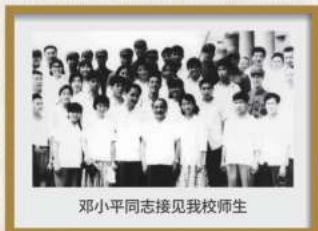
邓小平同志接见我校师生