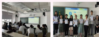
求职技能训练 为优秀学员颁发结业证书