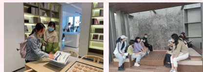
融创服务集团项目参访 与现场工作人员互动交流