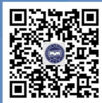
燕山大学 就业微信公众号

地址：河北省秦皇岛市河北大街西段438号 邮编：066004 传真：0335-8062526 电话：0335-8057038 8062526 网址： http://job.yzu.edu.cn E-mail: jjzd@yzu.edu.cn