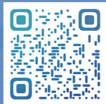
燕山大学 专业介绍