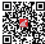
移动图书馆二维码